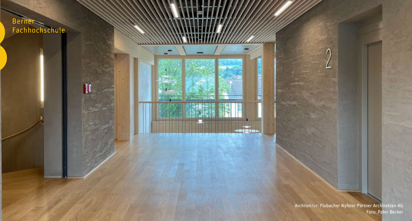
Architektur: Flubacher Nyfeler Partner Architekten AG